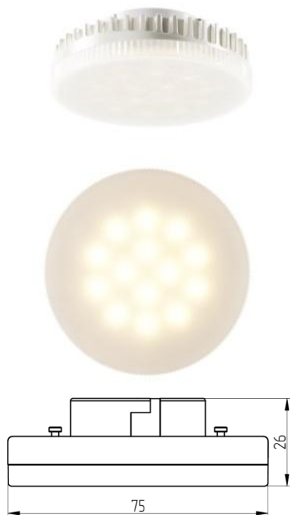
Рисунок 1 – Внешний вид.

Светодиодная лампа Geniled GX53 8W используется в накладных, встраиваемых светильниках в качестве замены люминесцентных ламп «таблеток» с цоколем GX53. Корпус выполнен из алюминия, пластика и матового поликарбоната.