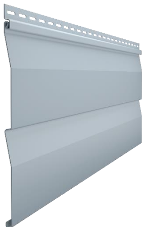
Сайдинг D4,5DL (корабельный брус, 4,5")