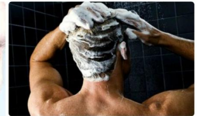
Перхоть - проблема множества современных мужчин