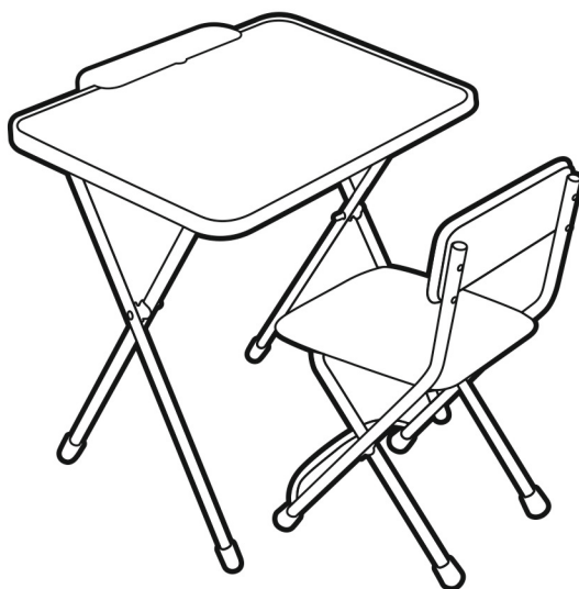
(рис. 1) арт. Ф1А, арт.Ф13

Соответствует требованиям ТР ТС 025/2012 «О безопасности мебельной продукции» ТО 561812-001-84597115-2014. Индекс СН, СНТ.