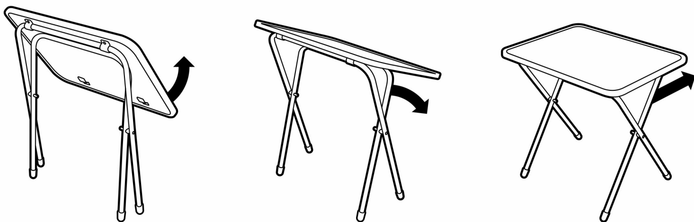
(рис. 2) Схема раскладывания стола (механизм «Познайка»)