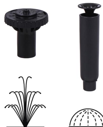
РИСУНОК РАЗБРЫЗГИВАНИЯ НАСАДОК