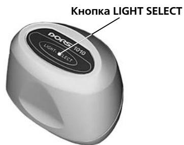
Рисунок 4 - Телевизионная лупа DORS 1010

Телевизионная лупа DORS 1020 (рис. 5) подключается ко входу V1 и позволяет проверять наличие инфракрасных (ИК/IR) и ультрафиолетовых (УФ/UV) меток в отраженном свете, проверять поверхность банкнот и др. объектов в белом косопадающем свете, контролировать наличие микропечати. Подключить лупу DORS 1020 к гнезду V1 на задней панели прибора.