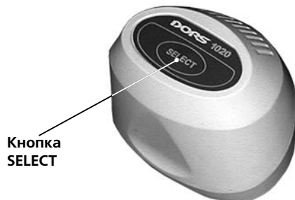
Рисунок 5 - Телевизионная лупа DORS 1020

ПРИ ПОДКЛЮЧЕНИИ DORS 1010 ИЛИ DORS 1020 К ДЕТЕКТОРУ DORS 1100 ДЕТЕКТОР ДОЛЖЕН БЫТЬ ОТКЛЮЧЕН ОТ СЕТИ ЛИБО НАХОДИТЬСЯ В ДЕЖУРНОМ РЕЖИМЕ