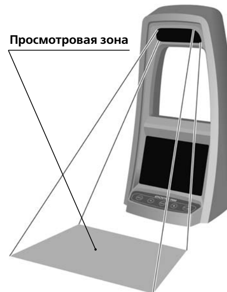
Рисунок 3 - Расположение просмотровой зоны прибора

запрещено). Интервал изменяется кнопками « + » и « - » с шагом 10 мин. Поместите банкноту в ПРОСМОТРОВУЮ ЗОНУ, как показано на рис. 3.